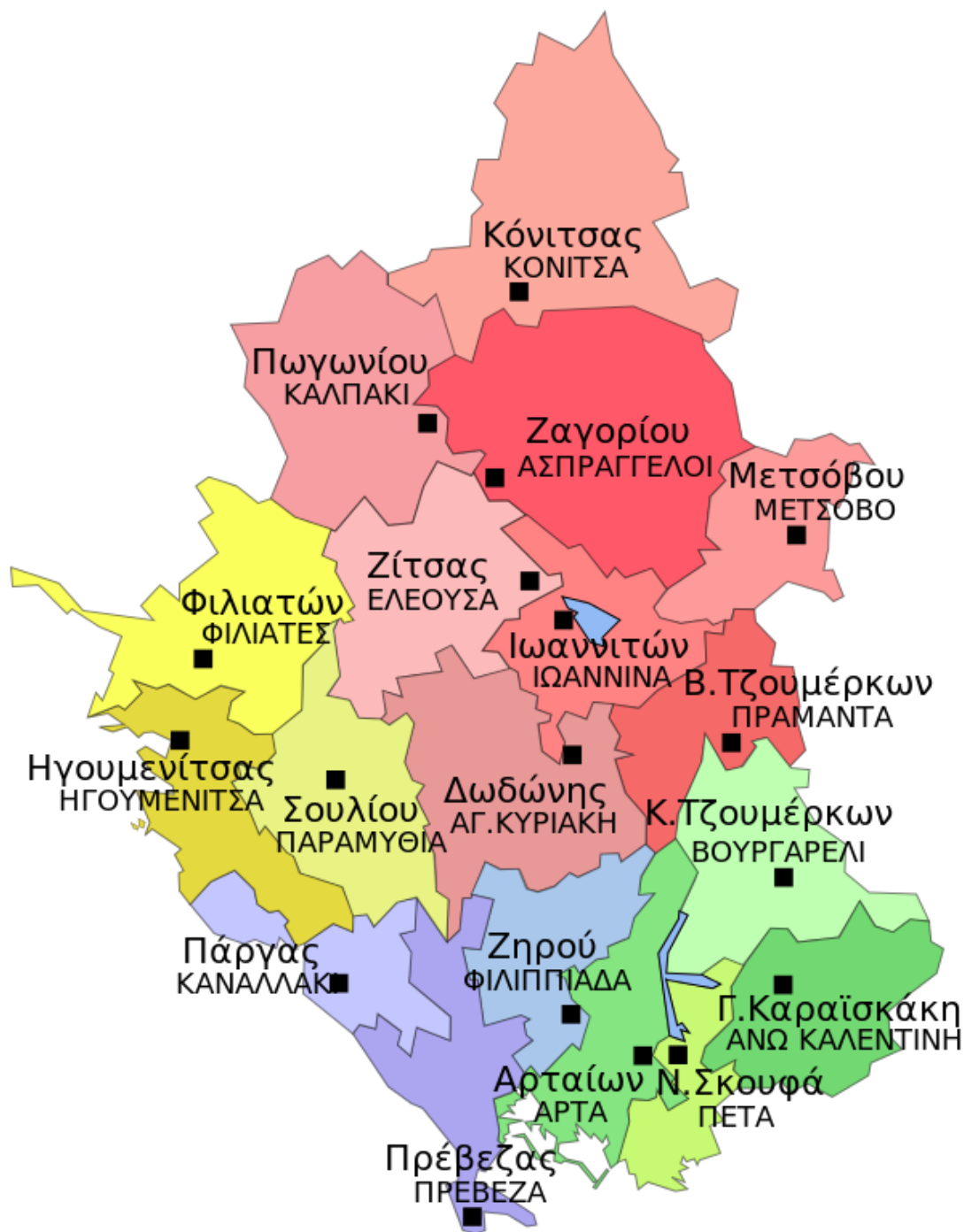
Διοικητική Διάρθρωση Περιφέρειας Ηπείρου (Δήμοι & Έδρες)