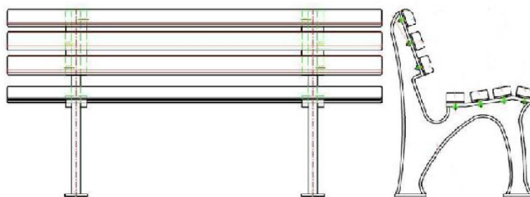
Υπόδειγμα ξύλινου καθίσματος (παγκάκι) με πλάτη