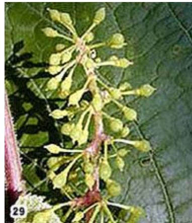
Ράγες 2 mm τσαμπιά αρχίζουν να γέρνουν.