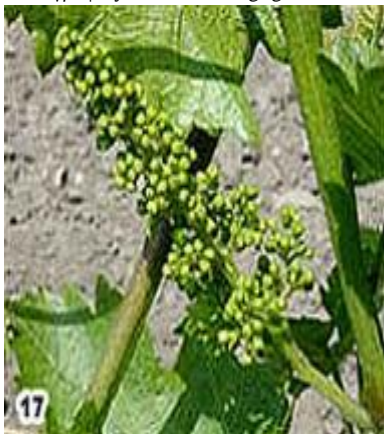
Ανθοταξίες πλήρως αναπτυγμένες με χωριστά άνθη.